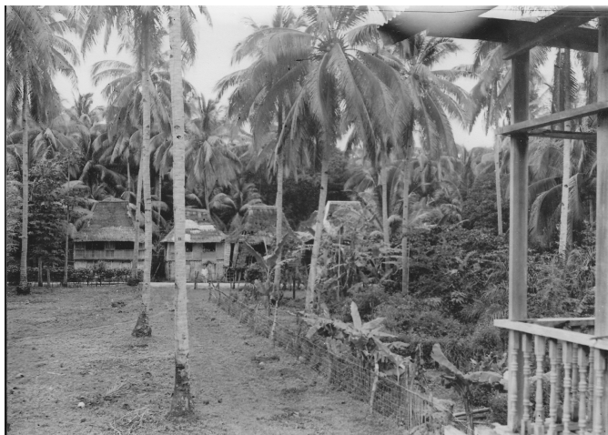
Fundatio Sancti Benedicti in insulis Philippinis facta.

tionis aedificandam inveniri debuit, quā de causā etiam viae struendae atque pontes exstruendi erant. In initio ergo mediā in areā duae parvae domunculae stramento tectae erigebantur, quod «monasteriolum» Sancto Benedicto dictum erat [ San Benito ]. Magni autem momenti erat, quod tertia pars areae