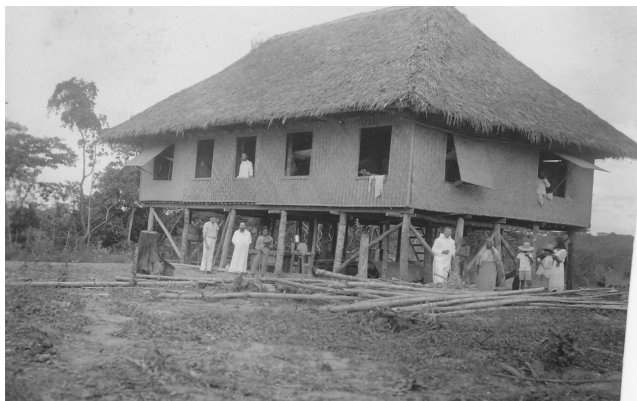
Nova domus in statu aedificandi. Photographemati manu titulus inscriptus est, qui est «Domus nostra».

munere Superioris fungeretur. Tamen eius gubernio videtur ibidem non nimis prospera fuisse, cum eius modus ducendi communitati non prodesset.